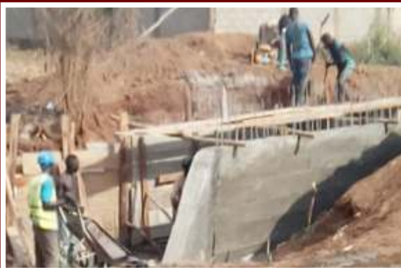
Construction d'un Dalot à TOHOUN