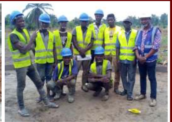
Equipe des entreprises BTP Mon REVE