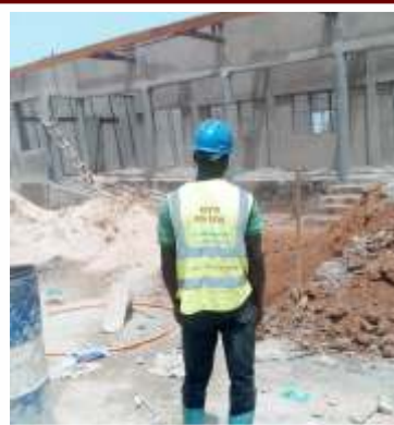
Construction du CRA à TOHOUN moyen mono